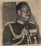
Uga'gun Aguiyi Ironsi