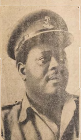
Olisa Adekunle Fajuyi Gomina Ologun Iwo Orun

kunle Fajuyi tun yan Alafia Oba Ode Oyo Alaiyeluwa Gbadege— pe ki o ma a se igosin Ladigholu Keji, keji akoso Igbimo