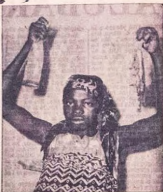
Lydia Olatun-dan pebi ohun iha aje re

Mo wa pe akiziji ayin onkawe si ero awon mejji na pe, o tako ara won. Bi ero etarin mejji ba si tako ara wot bayi, bi nikan ba je