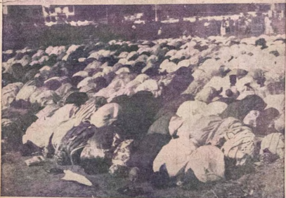
Aworan oke yi ni ti awon Musulami Eko nigbati nwon nkirun Itunu Awe ni Qbalende. Lehinti nwon ti kirun tan, ti nwon si se adura ni onikaluku ba lo si aye won nibiti nwon ti tun to lati ma a lo sile won pelu orin iyin fun Qlrun (Wo oju ewe kerindinlogun fun irohin)