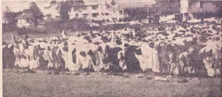
Awon yi ni ti igbati awon Musulmani, niwon lati wale fan Olerin ni O- lende loju kirun Itunu Awe. Eyi ti awon na won loyi ni ni nwon npe ni Rakas I'ede Larubawa.

Awon ti oju Alaka pe pu- pu, o si isarin. Oju kan- kan ni awon Ijo Ibe ki Irun ti won, ninu Lemons-Agba Iadi Alade Ibrahim ni Obalande.