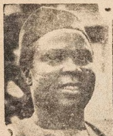
Oloye S. L. Akintola Alakoso Ijoba ipinle Iwo Orun

Oniwere Irohin wa tun fiye wa pe Alakoso Ijoba Ipinle Agbedemeji Iwo Orun Naijiria Oloye Dennis Osadebay tun pelu a wo on olori egbe Alakuko ti o de si ilu Eko l'ana. Irohin na tun fi ye wa pe Oloye Osadebay si wa fun eto ipade egbe na ati fun ipade awon Alakoso Ijoba ile Naijiria eyiti nwon yio se ipade re larin ose yi.