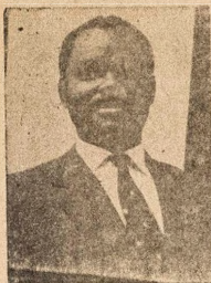
Ogbeni Aia Nwchukwu Alakso Eto Eko Ti Ijoba Apapo

Nitori idi eyi gbgoba wa obi ni oru na nbawi ti o ba ro fe igba ko le yipada fun iro fun fun ni eyi fun oigba ko lo bi orere, o le je olo wo lo ni iwo ko ma mo ile ti yio mo ba o lola gbgobo lo wa ubi ti nwon ti nse eto eko ofe sugbon nitoripe ko si wahala fun omo teni ofin ti o le ti ko yeki a lo ni a o gba si silẹ, iwo ti o nse eyi