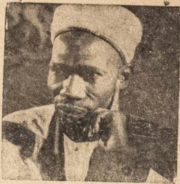
Wo Oju Ewe Kefa