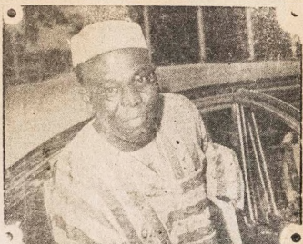
Oloye Obafemi Awolowo BABA OLAYINKA