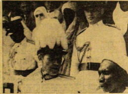
Aworan oke yi ni ti igbati Olọla Alhaji Abukar Tafawa Balewa, Alakoso Apapo Ijọba Najirra, mba Olọla Gawain Bello, Gomina Ijọba Ipinlẹ Ariwa soro nibi ajoyọ oḡorun oḡun ilu Lokoja. Awon oḡa Onise Oba ati awon Onise Olorin ni o duro lehin won.