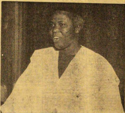
OLOYE SAMUEL LADOKE AKINTOLA

Lowo oda ati iran, ofa Re ati ota ode, amehin ati afamotihin, aseni kanifara, an-aju febi ma Eykan febi, afere keke hanje fehin, alakoba ati aladunranmu, alaraka ati agbesiyei, lawo ocun ati itagiri ati lowo Iba ojiji, Otowa rere gba wa. Ap.