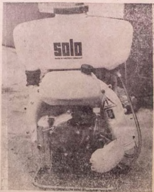
SOLO COCOA SPRAYER N220.00

TI GBE ERO ALAGBARA-NLA KAN DE! IWO AGBE TI NWA OWO. O KO MO PE. "OWO L'A FII PEENA OWO!" KINI SE TI O KO GḢYANJU KI O RA ERO WA YI TI NIE--