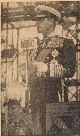
Aworan eke yi ni Igbati Asoju Obabinrin Gees Omoba Philip nk. iwe ti Oba binrin Ge, si ko si Ijoba Malawi ati awon enia ati Oriṣe ede na fun ikini pe mo ba o yo l seko ti Oriṣe ede Malawi gba Omaira.