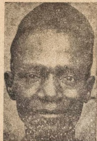
Alhaji Aminu Kano

Irohin tun fi ye wa pe okunrin kan ti ile re wa ni tosi ibudo awon Olopa to si lo ero ifi iranse ranse si ogba awon Olopa ti ile Najjiria ni ibudo won sugbo ki awon Olopa yi to de ibudo awon Olopa na ti awon Ehanna na ti salo Irohin fi ye wa pe awon Olopa si mu okan ninu awon enia na ti nwon si ti mole ni ibudo awon Olopa ti rogbo iyan ti sele.