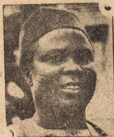
Oloye S. L. Akintola

Alhaji Aminu Kano so pe etoyi je ohun to ya en l'enu lati ri pe iru owo to po jaborata bayi ni nwon yio fun egbe eselu kan ti awon enia ko ma rara gegbebi egbe eyiti Oloye Akintola ese otori re egbe Demu (N. N. D.P.) Alhaji Aminu Kano so pe nigbati ko i ile eko fun awon omo lati lo ke eko ati pe opopolu awon enia ni ko ti se