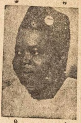
DR M. I. OKPARA Olori Egbe N. C. N. C.

Nigbati a won igbimo eto ibo na tun joko fun