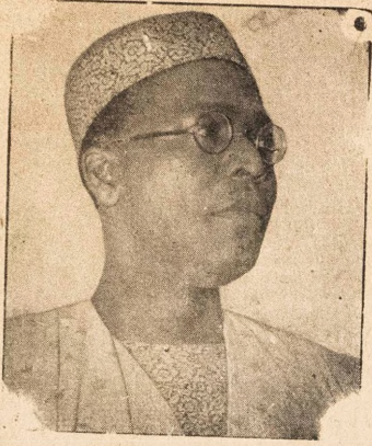
Oloye Obafemi Awolowo Olori Egbe Afenifere

eto nipa ijoko idibo na ni irohin fi ye wa pe awon egbe Oselu pelu igbimo eto ibo si ti jijo ni adahun kanna lori awon agbegbe kan ni ipinle na,