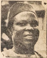
OLOYE S. L. Akintola

pinu fun awon Okunrin ati Obinitan lati le lo lasaka Idibo ati lati le ma da tadawa si Apoti ibo, ti awon Alatako egbe won ni Irohin na tun fi ye wa labele pe eto Eko ti awon omo egbe Oselu na nfun awon enia na siti bere na ki ojo Abameta ti ise oja kedogun osu yi ni ile okanrin awon Olori egbe Ose u kan ni lbadan lati le tete mo Eko ise buburu na. Irohin na tun fi yewa pe awon egbe Oselu na yio se inirwo fun awon enia ti non kojo na kakiri ipinle Iwo Orun lati wa gbinya ju gegbe won yio se lo kalamu na si lasoko Idibo. Ninu irohin na ati gbo