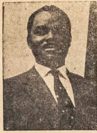
Ogbeni Aji Nwachukwu Alakoso Eto Eko Ti Ijoba Apapo

Ni ipari ipade na awon obi ko na si lo wo gegbe bi awon omo ile Eko na se nje onje ti Ijoba se iranlowo re fun won ni ile Eko ti Ijoba ni Surulere Awon Obi na si so ninu oru won pe awon ti awon omo nje lori onje na ti ju kobo meta (3d) tabi kobo mefa (6d) to je pe o je owo onje na.