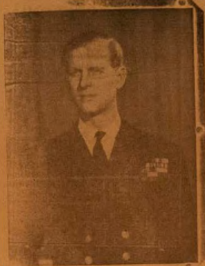
OKO ỌBABIRIN OJA EDINBURCH

Iro na a be awon Igbimig lati ha ni fi eyi si ero lati tipe won mu gboḡo amara wa si se. A si ti foju si oja pe won o mu. Olotu iba re o, Oḡo Oba ko ni sa e lese.