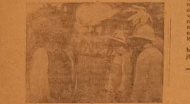
LOJA WINSBOR, OMO'BA WALES

Lati igbati okan nipa awon opitan imobin lati tan awon nipa. Awon eke yi ti wa ni omode lo ti je ero magiji yi mo pro yi wa igbo idare omode ko nje sife o Oko-Ife District Council lati je ero okun nigbati o dabi eni pe o lo tan nipa re; sifin eyi ni won je sara si ohan ni awon eni re ba je mo ko itan eja nipa iwe imobin lati ma wa si ile. Ni akoko yi ejo eri ki awon eni Ife District Council re ti ja ogoge odun i, bawo ni iru yio ran lati se iwadi to wipe olun eni bayi ti o ti lo eni ti o peju ti won ko je nipa. nipa oju aye re ni ala siji ti se. Bi won ba rope nipa bi awon ni le je opitan odu bawo opitan eke? awon eni ti yio wa, wun itan ara. Ki je ohan iyalenu pe eni ko won je ni o sifin ko je gbo gbo ba ni ipe pataki kan igbo ni lati eni ni o firan eke ju odu si je odu nipa idare ki o si ma pita okunkun ju imole lo.