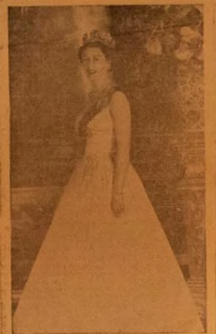
OBABIRIN GESI NI IYEWU RE