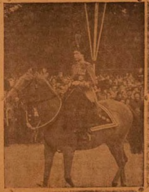
OBAHIRIN GESI LORI USIN