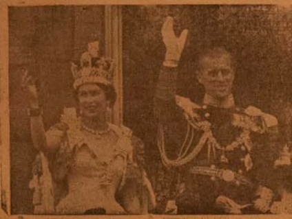
OBABIRIN ILE GESI ATI OKO RE

Odindi ejo mekalanlogun si won fi se ibewo Nigeria. Lchin ti won ti de awon Ekuu meteta to wa ni Nigeria won ti lo ni ejo kiranidologun oju yi. Gbagbo awon to lo woran won nigbati won alo lati woko ni won ni awo jump si ni idaghere pe "o dabo, o digboje" Irohini ti de Nigeria pe alafia ni won gawo ni London.