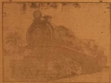
OKO OJU IRIN

Bi o tife jepe agboṣo na tun bo ntan kalẹ, ami idaniloju ko i ti si pe OTITO ni. O ha le je otito bi?