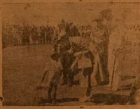
OMO'BA TO DI QBABIRIN GESI

Oko ni pelu mo, ninu biba awon ara Ekuu yi ni yola tesiwaju isawon ti ni, be Olorun lati fun won ni orire lati iwoyi lo ati titi failati.